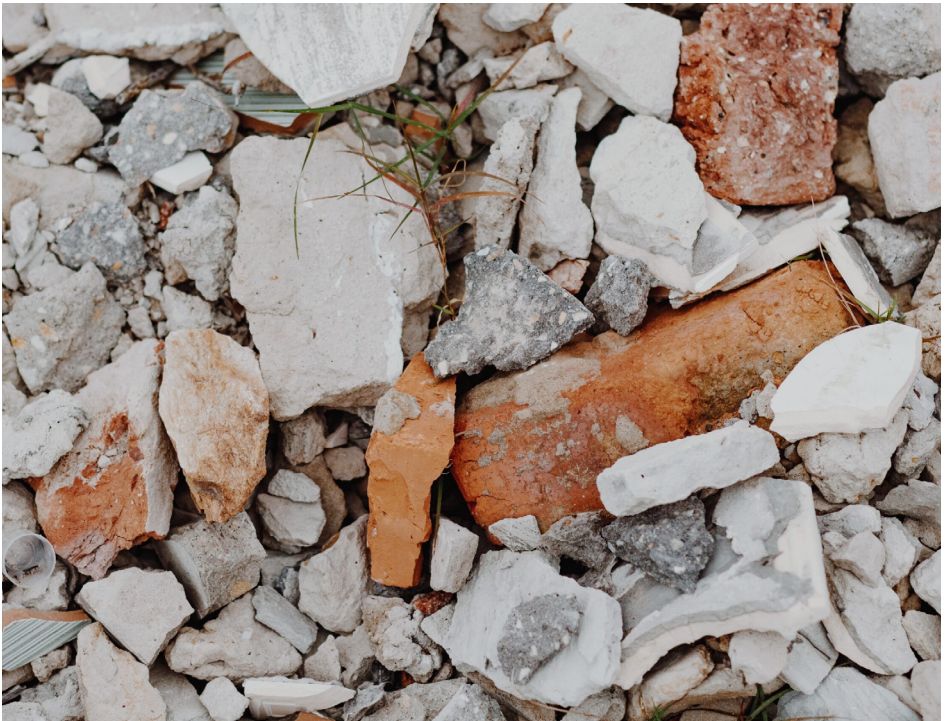
ფოტო 5: ინერტული ნარჩენი.

ინერტული ნარჩენების მაგალითებია ბეტონი, აგური, კერამიკა, ქვის ნამსხვრევები, სამშენებლო ნამსხვრევები, მინა (არაბიოდეგრადირებადი, ქიმიურად სტაბილური), ასფალტის ნარჩენები, თიხის ან მიწის მასალა, მიღებული სამშენებლო საქმიანობიდან და სხვა მსგავსი მასალები.