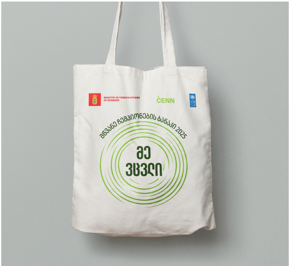
ფოტო 4: მრავალჯერადი გამოყენების ჩანთა.

პრევენცია გულისხმობს რესურსების გონივრულ გამოყენებას და წარმოების ისეთი მოდელების შემუშავებას, რომელიც პროდუქტის დიზაინის ეტაპიდანვე ნაკლები ნარჩენის წარმოქმნას ითვალისწინებს.