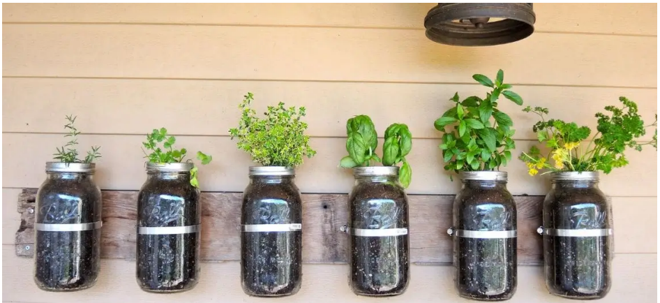
ფოტო 5: ნარჩენის ხელმეორედ გამოყენება.

მაგალითად, მინის ქილას შეიძლება მივცეთ ახალი ფუნქცია, გამოვიყენოთ სანათად ან ყვავილების ლარნაკად. ტანსაცმელი გადავაკეთოთ ჩანთად, ძველ ავეჯს კი რესტავრაცია გავუკეთოთ ახლის ყიდვის ნაცვლად. ეს მიდგომა ამცირებს ახალი რესურსების მოპოვებისა და მოხმარების საჭიროებას და ხელს უწყობს გარემოს მდგრადობის შენარჩუნებას.