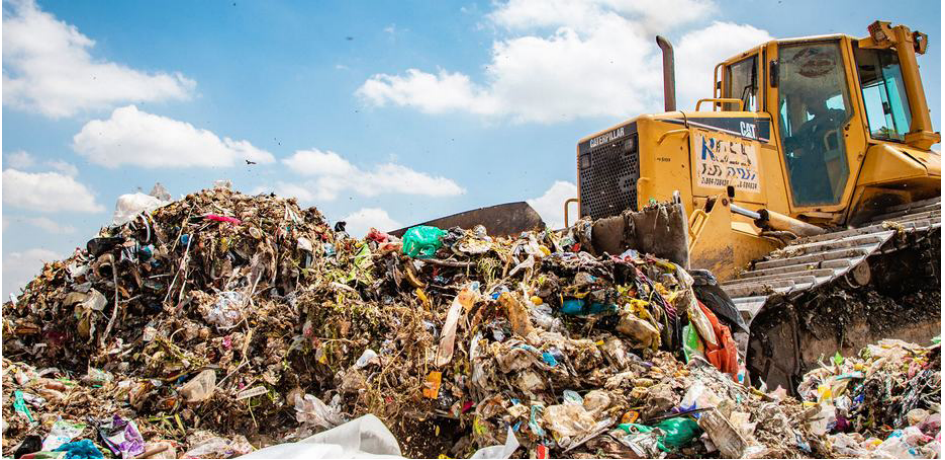
ფოტო 2: ნაგავსაყრელი კენიაში.

საქართველოს ქალაქებში მცხოვრები თითოეული მოქალაქე საშუალოდ 0,95კგ ნარჩენს წარმოქმნის დღეში, ხოლო სოფლის ტიპის დასახლებებში - 0,54 კგ 1 , რომლის უმეტესი ნაწილი ნაგავსაყრელებზე ხვდება. ნაგავსაყრელებზე აკუმულირებული ნარჩენები, არასწორი მართვის შემთხვევაში, აბინძურებს ჰაერს, ნიადაგსა და წყალს, მათ შორის შავ ზღვასაც, რომელიც ქვეყნისთვის მნიშვნელოვანი რესურსია და განსაკუთრებით დასავლეთ საქართველოს მოსახლეობის ცხოვრებაზე ახდენს დიდ გავლენას.