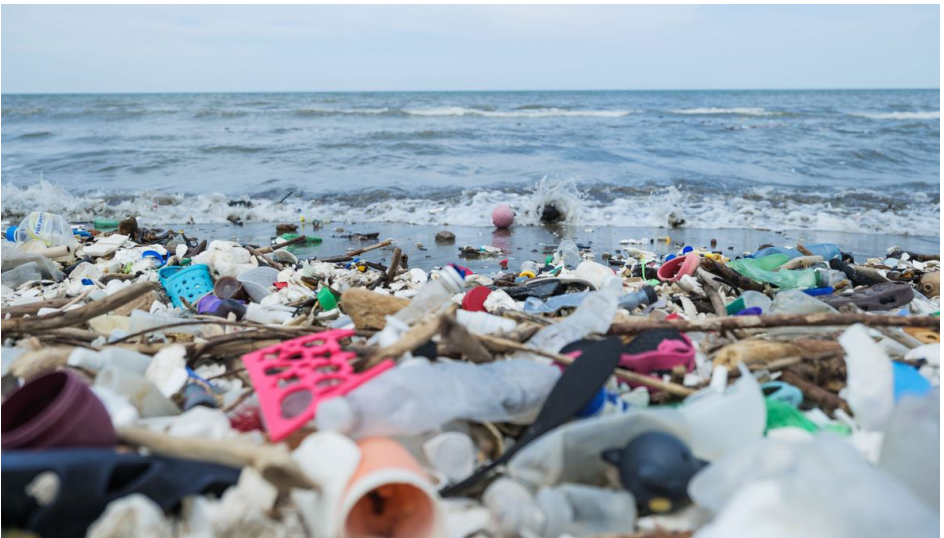
ფოტო 1: დაბინძურებული სანაპირო, ჰონდურასი.

მსოფლიოში ნარჩენების რაოდენობა ყოველდღიურად ძალიან სწრაფად იზრდება. ნაგავსაყრელები ივსება, ბინძურდება მდინარეები, ზღვები და ოკეანეები, ჰაერისა და ნიადაგის ხარისხი ყოველწლიურად მკვეთრად უარესდება. საქართველოც, სხვა მრავალი ქვეყნის მსგავსად, ამ პრობლემის წინაშე დგას. შავი ზღვის სანაპიროებიდან მთა-გორებამდე ნარჩენები გავლენას ახდენს ჩვენს ჯანმრთელობაზე, გარემოსა და ეკონომიკაზე.