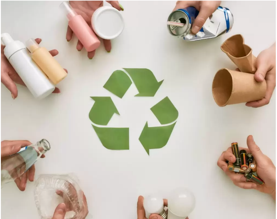
ფოტო 3: გადამუშავებადი ნარჩენები.